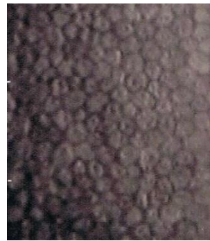
コンタクトレンズをほとんど使用しないスタッフの写真。どの細胞もほぼ同じ大きさ